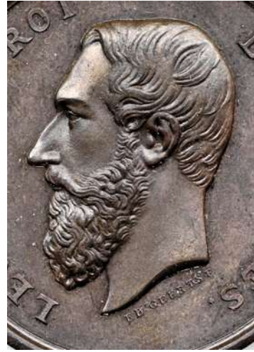
Hoofd van Leopold II met signatuur Geerts

Een overzicht van de bestudeerde exemplaren: