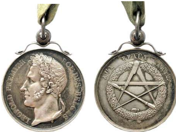
Prijspenning zonder rand met aangehecht draagsysteem en lint (KBR K348/07)

De instellingen hadden echter een probleem omdat er geen plaats was voorzien om de naam en de discipline van de laureaat te vermelden. De meeste exemplaren zijn daarom voorzien van een randgravure. Sommige Academies lieten iets graveren op de keerzijde, buiten de krans rondom onderaan, maar daar was niet voldoende plaats. De Gentse Academie heeft dit nooit gedaan maar liet altijd op de rand graveren.