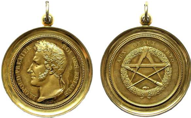
Prijspenning gevat in een extra rand (KBR K342/11)

een tekenstift. Op het lint staan de namen van belangrijke Belgische kunstenaars A. VANDYCK | WARIN | EDELINCK | F. ROMEIN | DUQUESNOY | P.P. RUBENS en rondom bovenaan, buiten de krans, staat AUX BEAUX ARTS.